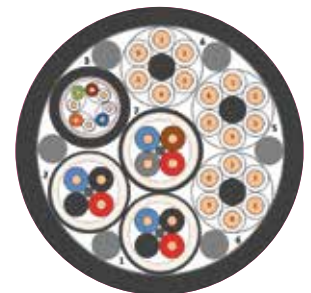
BETAtrans® GKW-ENX flex R black 3 \times (6 \times 1.5) + 1 \times (4 \times (2 \times \text{AWG } 26/7)\text{St})C 100 Ω GigaCAT 7+ 2 \times (2 \times 0.5 + 1 \times 0.5 \text{ mm}^2)C 120 Ω MVB+ 1 \times (4 \times 0.5)C 120 Ω MVB