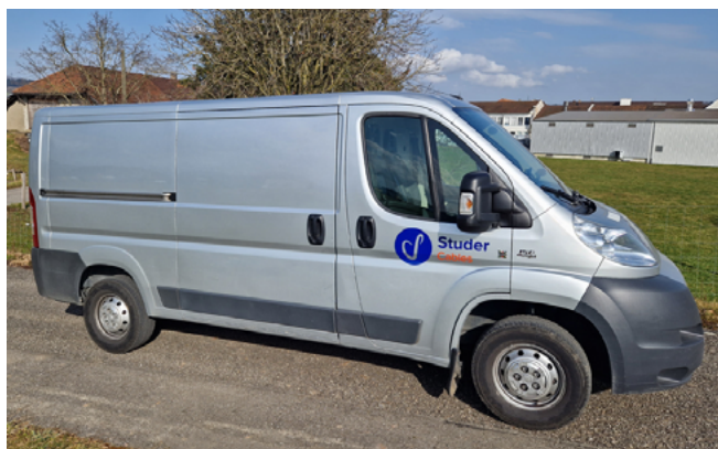
Montagefahrzeug Fiat-Dangel Ducato (4 × 4)