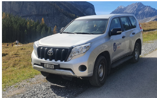
Montagefahrzeug Toyota Land Cruiser 3.0 (4 × 4)