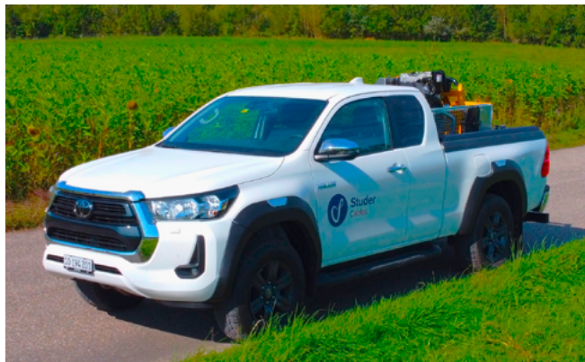
Montagefahrzeug Toyota Hilux 2.8 (4 × 4)