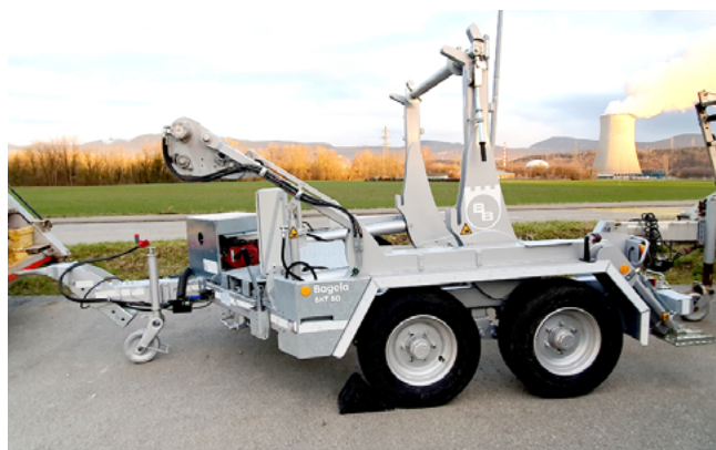
Verlege-Anhänger BAGELA BKT 80