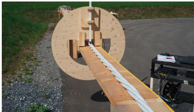
20 Meter langer Messtisch mit Teilungsapparat zur Messung der Magnetfelder im Nah- und Fernbereich.