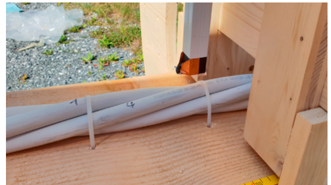
Sensor im Teilungsapparat. Die Ergebnisse werden mit einer unabhängigen Simulation abgeglichen.